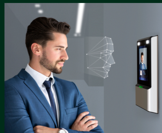
Controle de Acesso