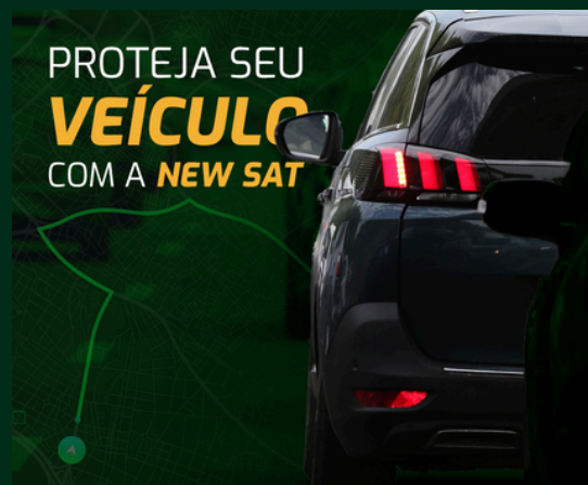
Rastreamento de Veículos