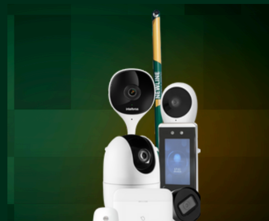
Vendas de produtos